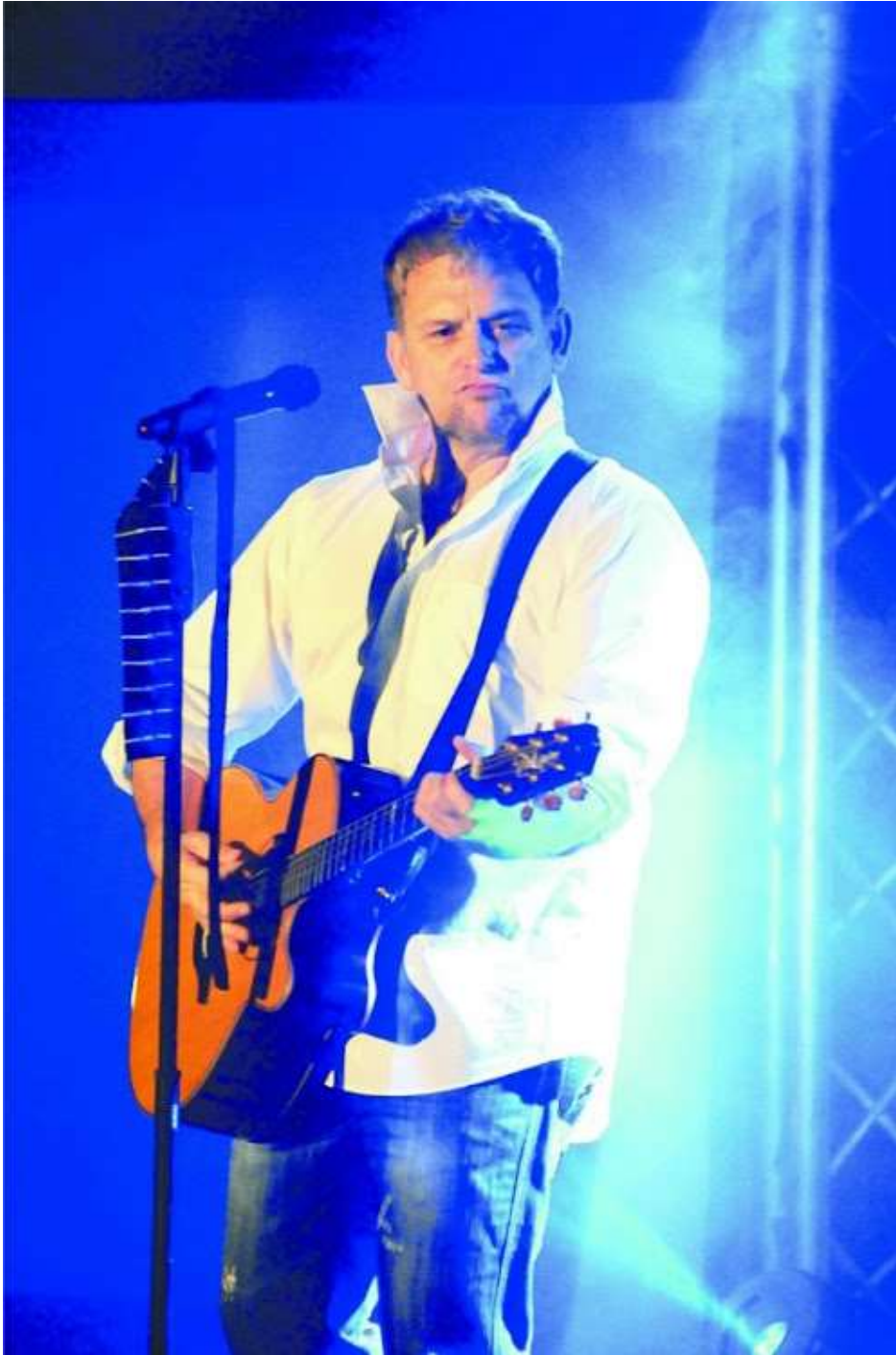
AFRIKANERNASIONALISME... Steve Hofmeyr