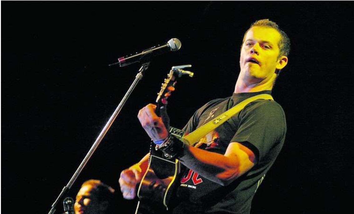
PATRIOTIESE NOSTALGIE ... Bok van Blerk.