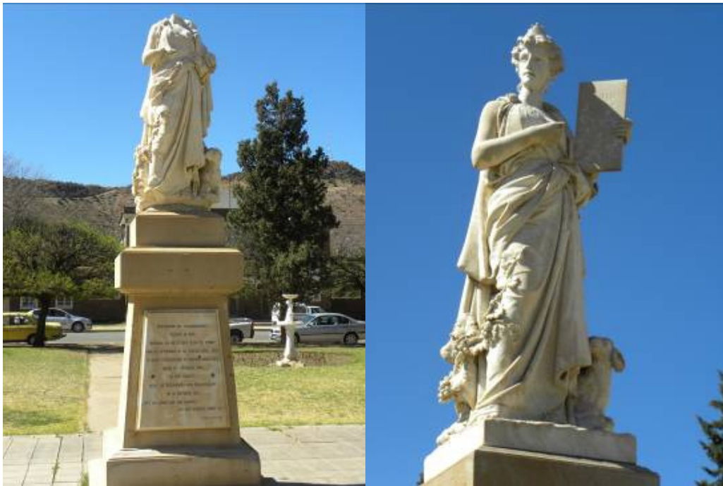
Oorspronklike monument links, replika regs

Burgersdorp, Oos-Kaap: Die oudste taalmonument in Suid-Afrika waarvan die ATM bewus is, staan op Burgerplein. GPS-koördinate: S 30° 59.632', O 26° 19.879'.